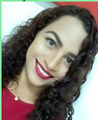
Mônica Melo Arte e Diagramação